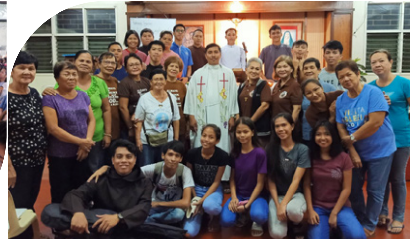
Celebración Tránsito de nuestro Padre Fundador Communauté des Amigiens, Abidjan (Côte d'Ivoire) África