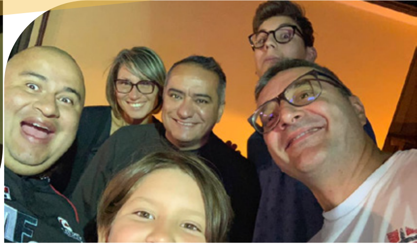
Celebración de nuestra fiesta patronal en la Parroquia Mater Dolorosa Parish - con el Cardenal Luis Antonio Tagle, Arzobispo de Manila