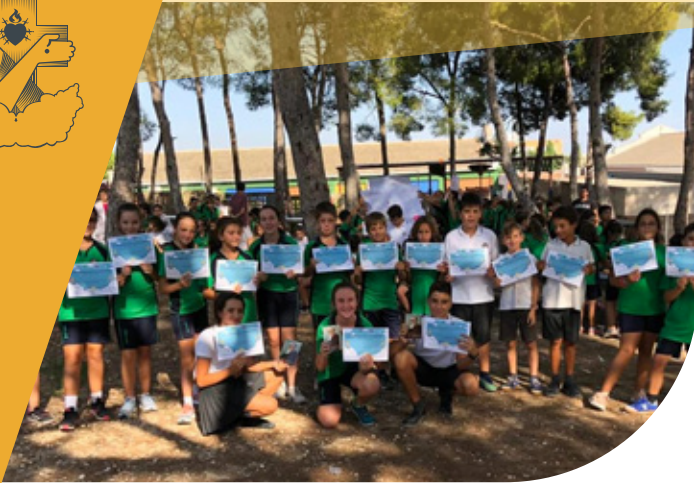
Casa Provincial Buen Pastor, San José de Costa Rica