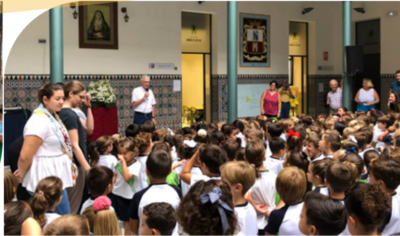
Instituto de Formación Toribio Maya, Popayán, Colombia