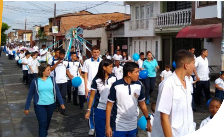
Instituto Preparatorio de Menores, República Dominicana