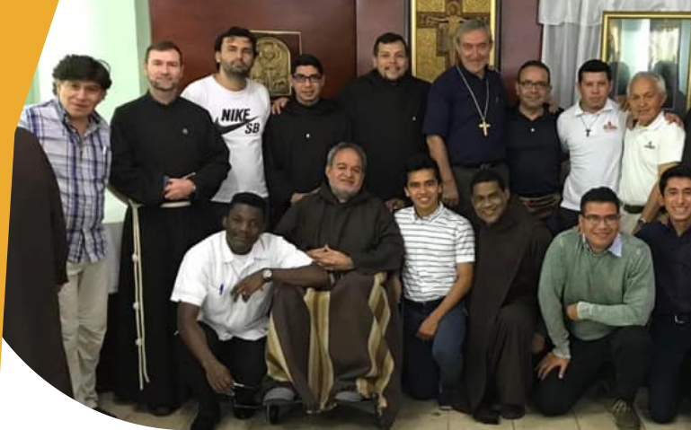
Itca San Giovanni Rotondo Italia