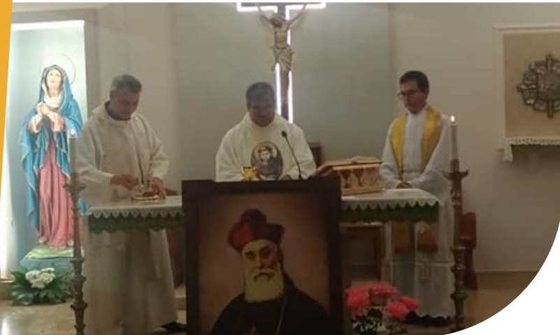
Amigionianos Puerto Rico