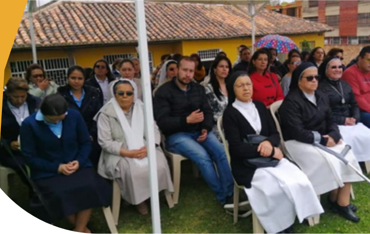
Instituto Técnico Industrial Fray Luis Amigó - Palmira, Colombia