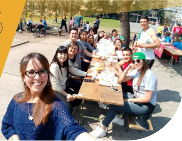
Centro Juvenil Amigoniano Boyacá, Colombia