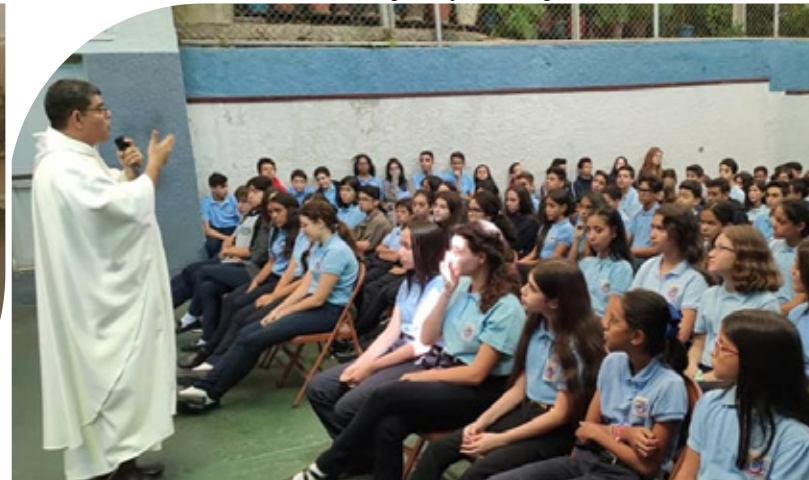
Amigionianos Puerto Rico