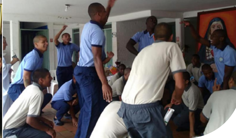
Colegio Fray Luis Amigó de Caracas, Venezuela