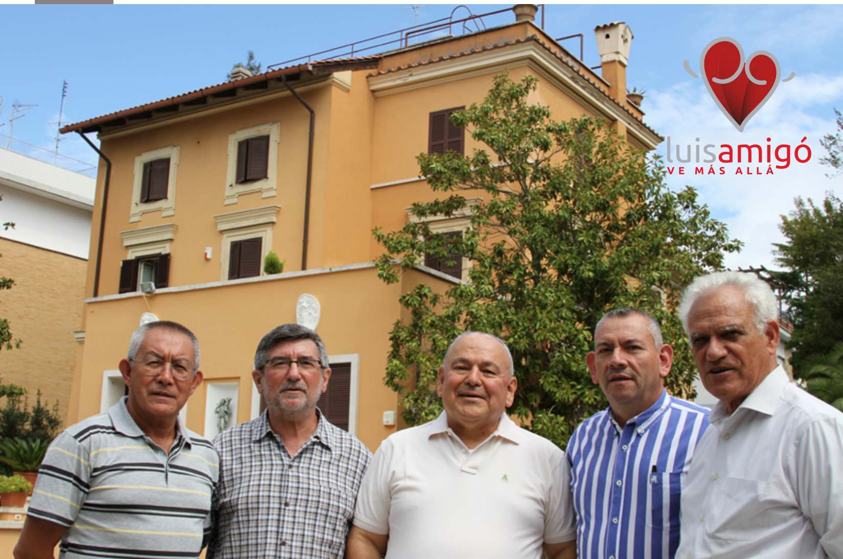
Fray Pedro Acosta