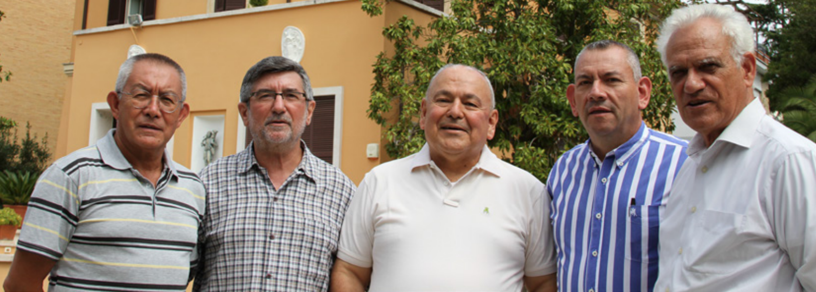
Fray Pedro Acosta