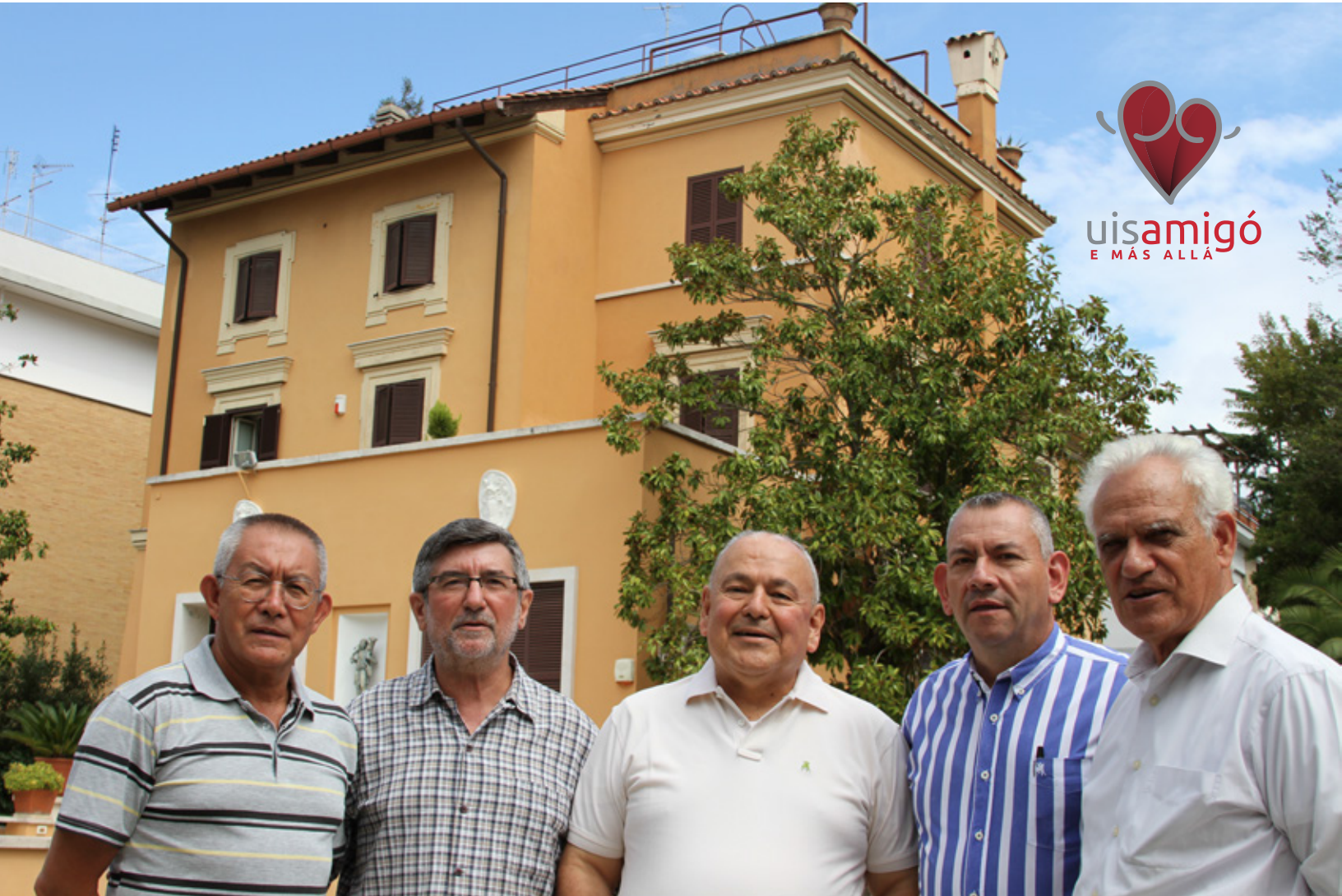
Fray Pedro Acosta