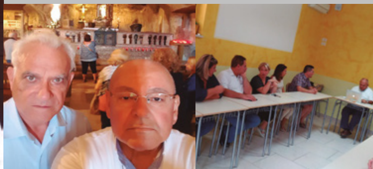
Visita Santuario San Miguel Arcángel.