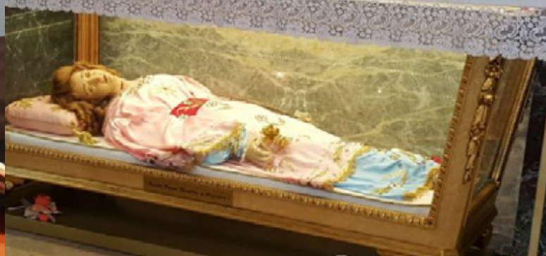
Cuerpo de Santa Irene que reposa en el lateral del Templo