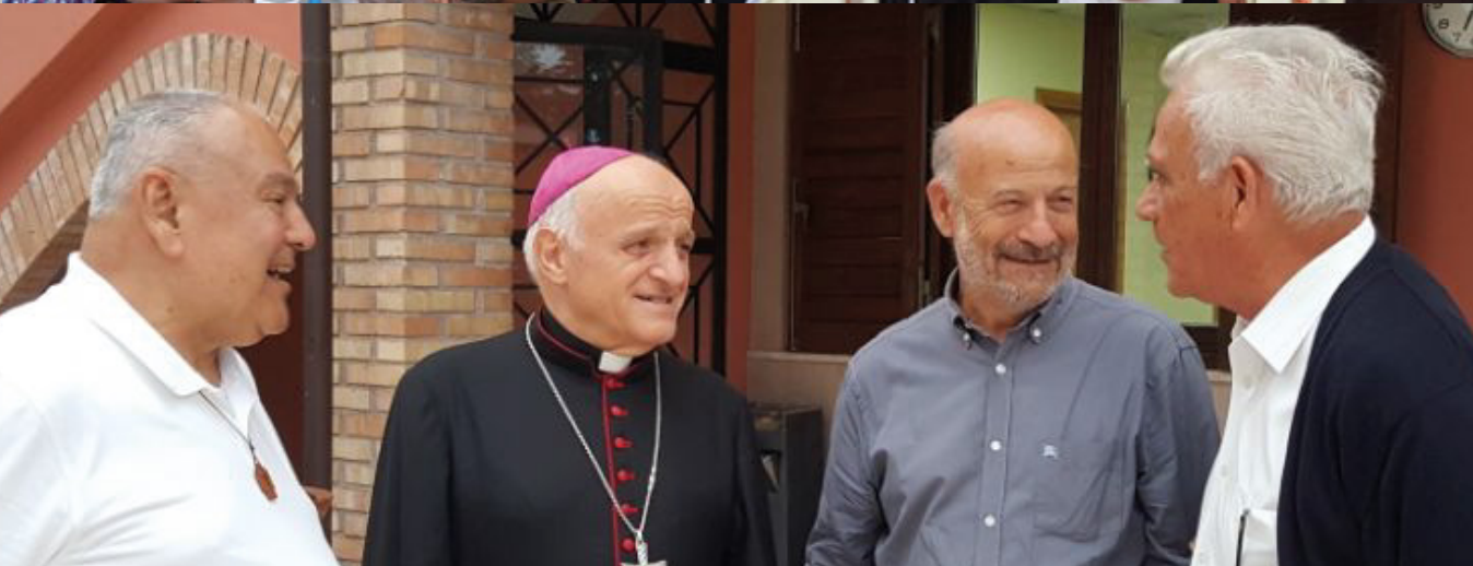
ACOMPAÑADOS POR MONSEÑOR GINO REALI