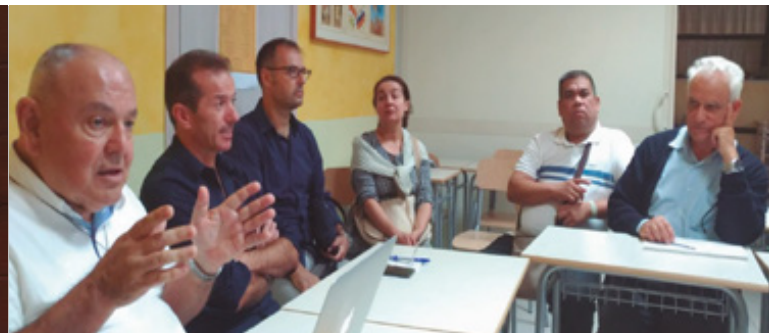
Encuentro con educadores ITCA