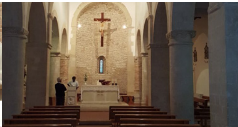
Templo del Convento dedicado a Santa Irene y data del siglo XII