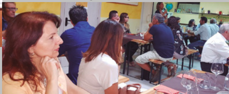
Encuentro con los productores de la región de San Giovanni Rotondo en la Oficina Amigioniana